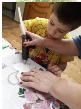
Ярослав из пенопласта ёлочную игрушку сердечко