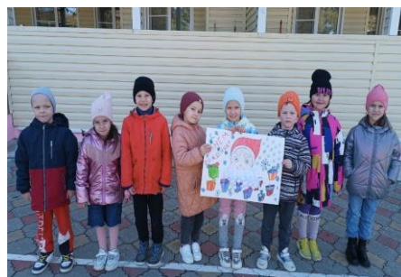
Ребята подготовительной группы 01 «Земляничка»